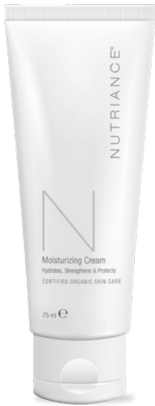
Kodas 364 | 75 ml

3 žingsnis: Aktyvinimas ir maitinimas – odos drėkinimas yra antroji trečiojo odos priežiūros sistemos žingsnio dalis, jis rekomenduojamas naudoti po serumo. Odos drėgmės lygio išlaikymas apsaugo odą nuo dehidracijos ir padeda saugoti nuo potencialiai žalingų aplinkos veiksnių.